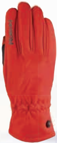
445 fiesta red