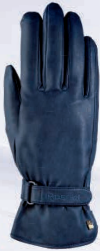
596 navy antique