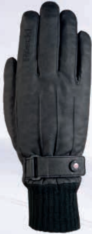
065 black stonewashed