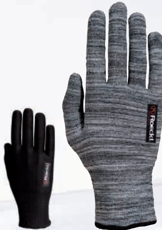
3406-446a* 000 black