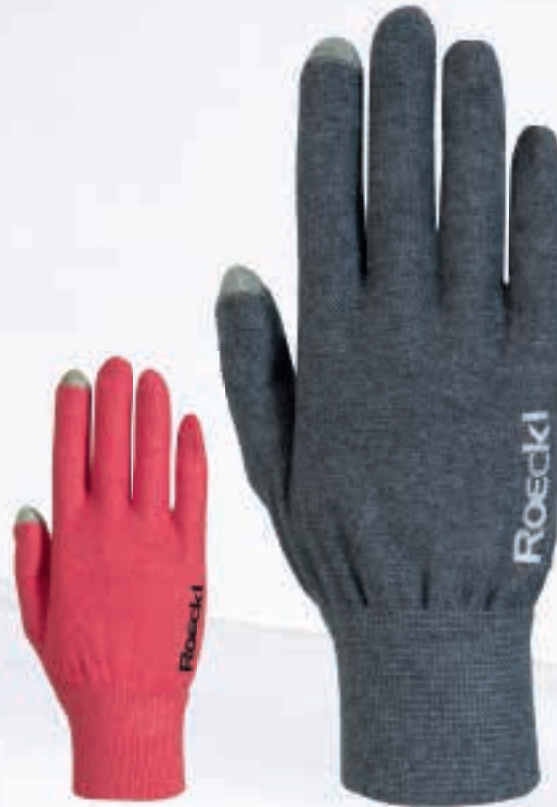
442 red melange