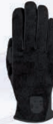
085 anthracite melange