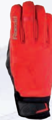
445 fiesta red