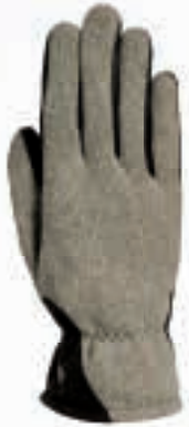
015 grey melange