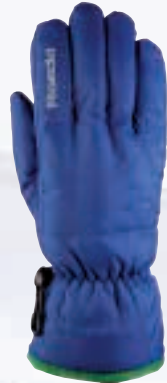
555 monaco blue