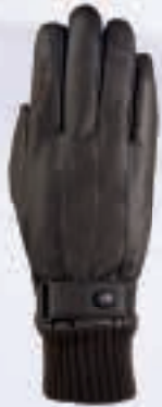
795 mocha antique