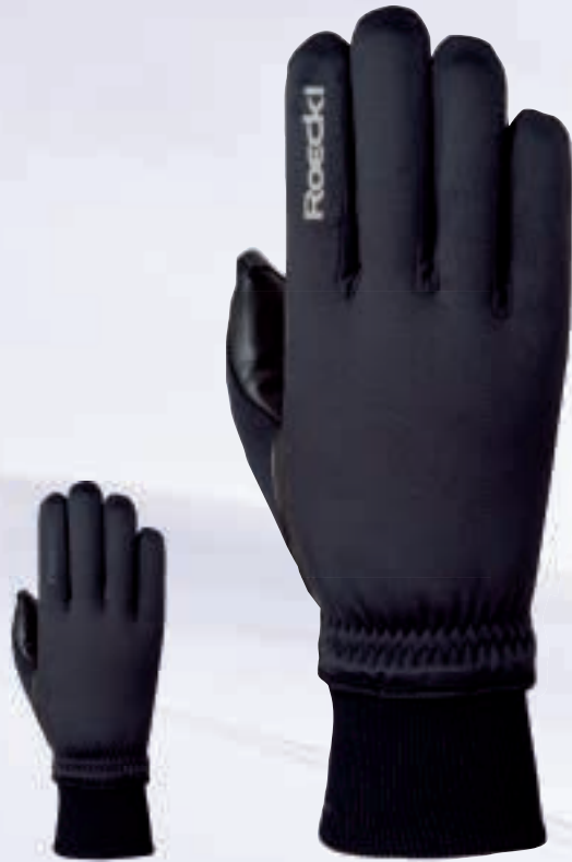
000 black (black Logo)